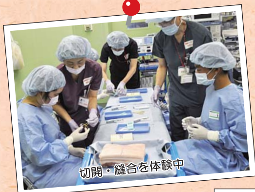
切開・縫合を体験中

参加者は会場毎に医療器具について説明を受けたり、実際に操作をしたりしました。普段では見たり触ったりすることが出