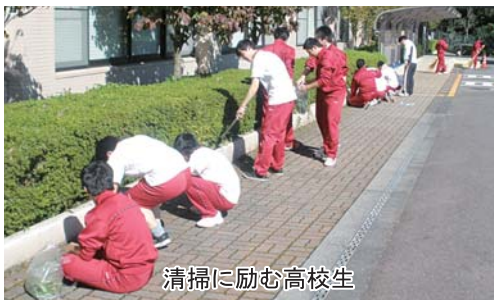
清掃に励む高校生

日差しが照りつける中で作業となりましたが、皆さん元氣よくゴミ拾いや草むしり等に取り組んでいました。すみずみまで清掃していただいたおかげで、駐車場はきれいになりました。 ご協力、誠にありがとうございました。