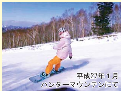
平成27年1月 ハンターマウンテンにて

そしてもう一つの魅力として、キッカー、グランドトリックなどのジャンプがあります。大自然の中を滑走することは、とても爽快で、天気がいい日の山頂からの眺めは絶景です。県内外、様々なスキー場に行きその土地ならではの食べ物、景色を堪能しています。これからスノーボードを始めた方、興味のある方は是非声をかけてください。