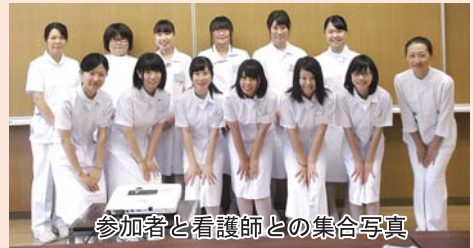
参加者と看護師との集合写真

7月27日・31日の2日間にかけて、栃木県内の高校生22名がふれあい看護体験に参加しました。