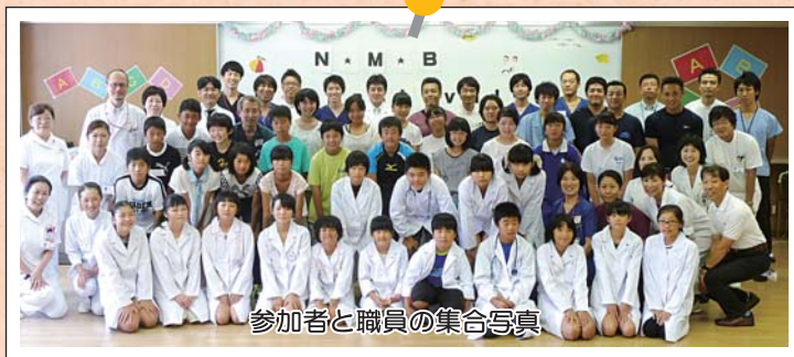
参加者と職員の集合写真

来ないものなので、皆さん真剣に、またときには楽しく体験に集中していました。 参加者からは、「様々な体験や見学ができて楽しかったです」や「病院に対する理解が深まりました」等の感想をいただきました。