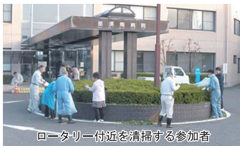
ロータリー付近を清掃する参加者

皆さん花壇の奥に生えた雑草の除草から植木の剪定まで幅広く清掃に励んでいました。丁寧に清掃していただいたおかげで、駐車場はとてもきれいになりました。 皆様のご協力、誠にありがとうございました。